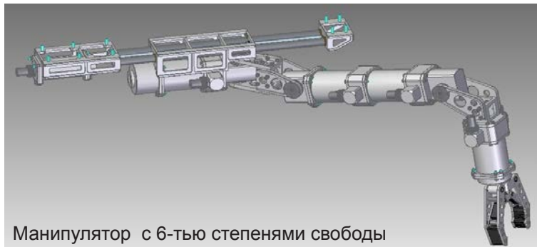
Манипулятор с 6-тью степенями свободы