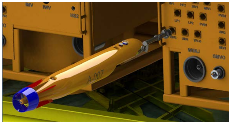
Концепт-проект СПбГМТУ и АО "НПП ПТ "ОКЕАНОС" АНПА с манипуляторным комплексом (на рис. представлена для примера устьевая донная арматура TechnipFMC)

Целью стало создание манипулятора с большим вылетом (850-1500 мм в зависимости от исполнения) и 5-6 степенями свободы, пригодного для установки на ТПА осмотрового и легкого рабочего класса, а также на АНПА и донные базовые станции. В настоящее время идет сборка первого образца устройства. В ходе разработки семейства АНПА (в т.ч. типа «глайдер») были сформулированы основные требования к создаваемому манипулятору: